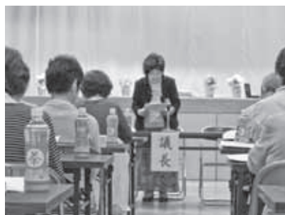
寺本会長による開会挨拶