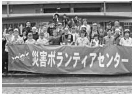
大津町の皆さんと一緒に