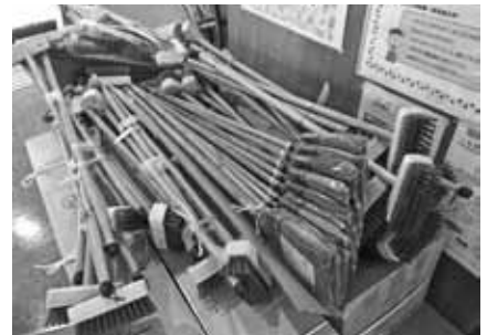
お届けした特産品の一部