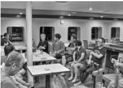
活動を終えてのふりかえり