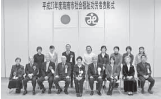
受賞おめでとうございます